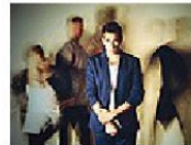
Festival Intercity Una scena di «Trainspotting»

(1993), che raccontava in prima persona storie di tossicodipendenza, sesso e violenza nei bassifondi scozzesi. La versione scenica del drammaturgo libano-canadese Wajdi Mouawad (ben tradotta, per la prima volta, da Nerina Cocchi ed Emanuele Aldrovandi, e adattata dagli attori) mantiene lo stesso